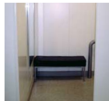
Provadores adaptados da Lojas Renner