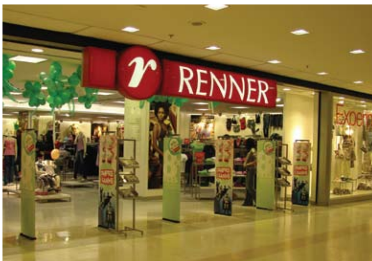
Fachada de um dos pontos-de-venda da rede

Aliás, esse é um princípio que a empresa destaca como um de seus valores: igualdade no tratamento com as pessoas. A prova de que essa receita dá certo em qualquer setor da economia está estampada na trajetória da companhia. Em seus 96 anos de história, a Lojas Renner vem se destacando por suas inovações. De uma simples fábrica de capas de pura lã e vestuário masculino, resistentes ao frio e ao vento, localizada no bairro de Navegantes, em Porto Alegre, Santa Catarina,